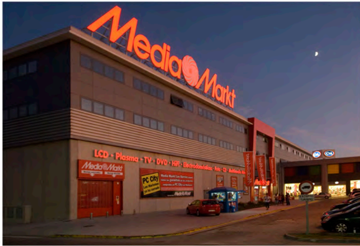
Fachada Media Markt