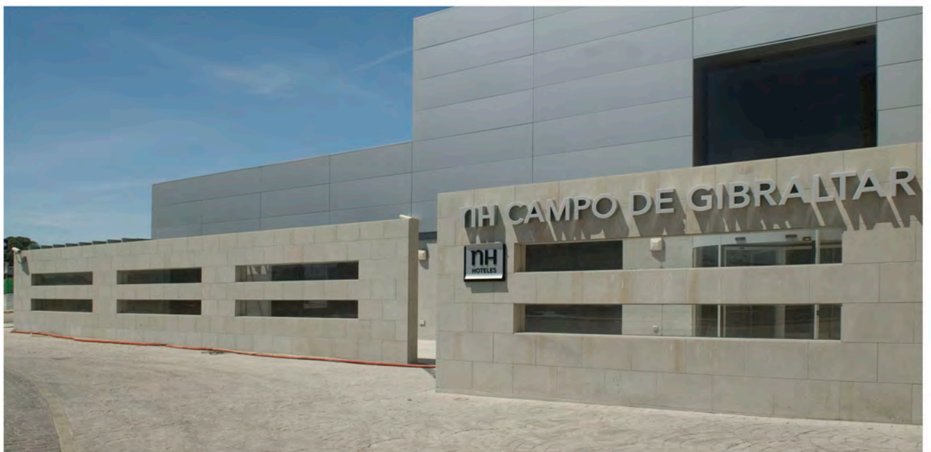
Acceso al Hotel NH Campo de Gibraltar